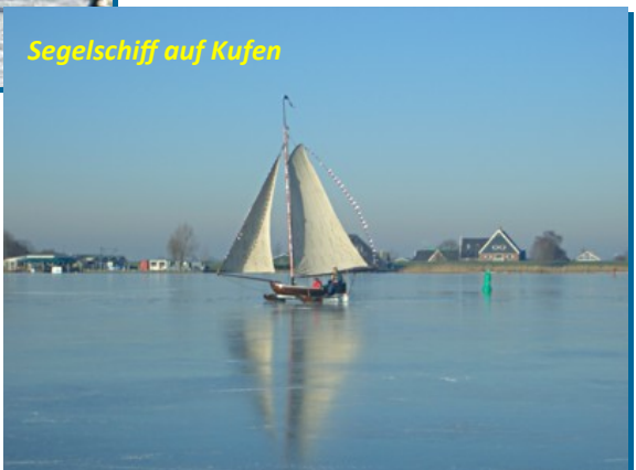
Segelschiff auf Kufen

Hier war auch noch eine Besonderheit unterwegs: ein Segelschiff auf Kufen. Diese Gefährten sind besonders mit Vorsicht zu beachten, denn sie erreichen bei etwas mehr Wind eine Fahrgeschwindigkeit von bis zu 80 km pro Stunde. Die Schiffe haben zwar eine Notbremse, aber der Bremsweg ist lang.