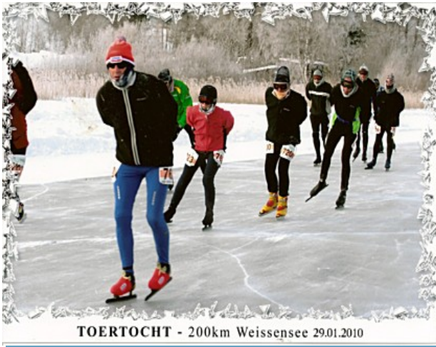
TOERTOCHT - 200km Weisseensee 29.01.2010