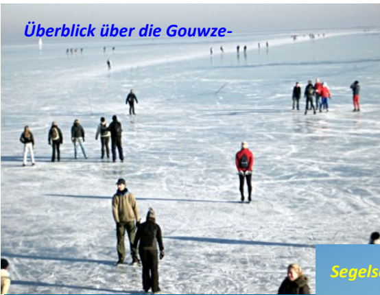
Überblick über die Gouwe-

Unsere Begeisterung von heute gilt den Volksläufen auf Natureis, wenn die Wetterkonditionen dafür gegeben sind. Leider klappt das in Holland nicht immer, weil dafür die Winter nicht kalt genug sind. Aber wenn, dann ist das Natureis-Erlebnis in Holland einmalig. Es ist eine andere Welt, wenn man die Natur vom zugefrorenen Wasser aus betrachten kann. Um einen besseren Eindruck zu vermitteln, habe ich einige Bilder vom Winter 2008/2009 eingefügt.